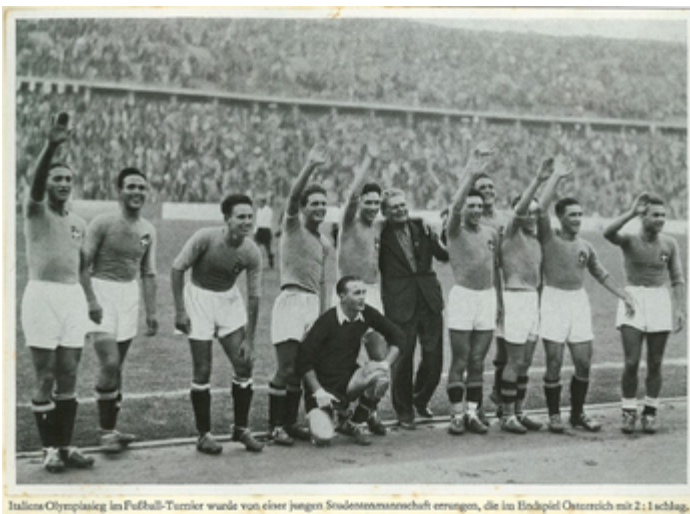
Italiens Olympiasieg im Fußball-Turnier wurde von einer jungen Studentensmannschaft errungen, die im Endspiel Österreich mit 2:1 schlug.

Quelques pages plus loin (p. 119), c'est le football qui est à l'honneur. C'est le sport des Jeux qui, selon le texte placé en introduction, « assure le succès économique des olympiades » (p. 118).